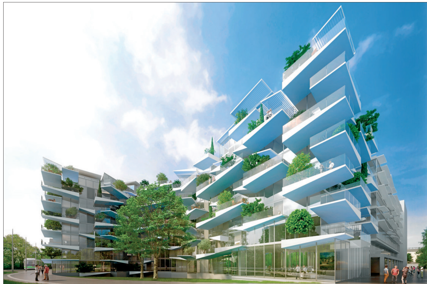
Voici l'une des futures résidences "Prado-Concorde" qui sera située entre la rue du Prado et la place Charles-de-Gaulle à Castelnau.

Souterrain. En contrebas, le long du Lez, la Ville prévoit d'aménager un parc arboré, avec un nouveau théâtre de verdure. La place Charles-de-Gaulle, où se trouve l'arrêt de